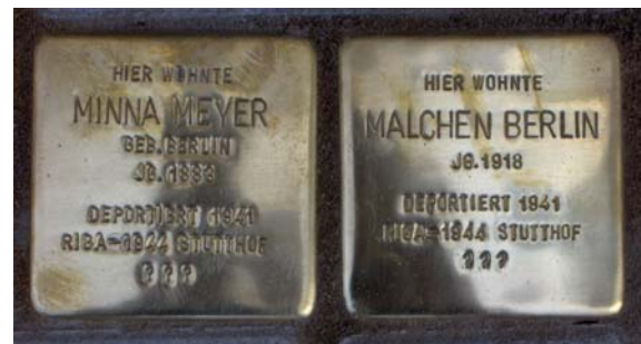
Die Stolpersteine in der Grindelallee 134