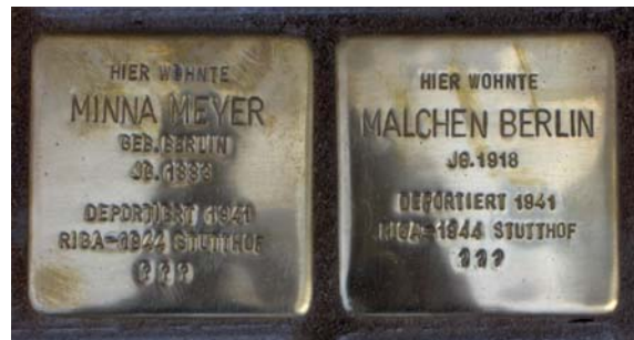
Die Stolpersteine in der Grindelallee 134