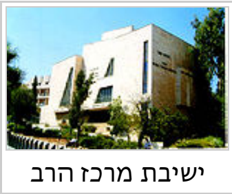
ישיבת מרכז הרב

הרב צבי יהודה נטל חלק גם בפעילות ציבורית ובמאבק היישוב להקמת המדינה. ב-1951 הוצב במקום ה-119 הסמלי ברשימת "הפועל המזרחי" בבחירות לכנסת השנייה.