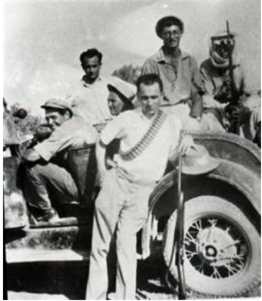
ליד ההגה בשמירה על השדות